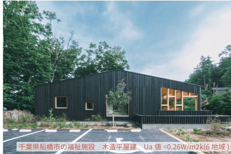
千葉県船橋市の福祉施設 木造平屋建 Ua 値 =0.26W/m2k(6 地域)