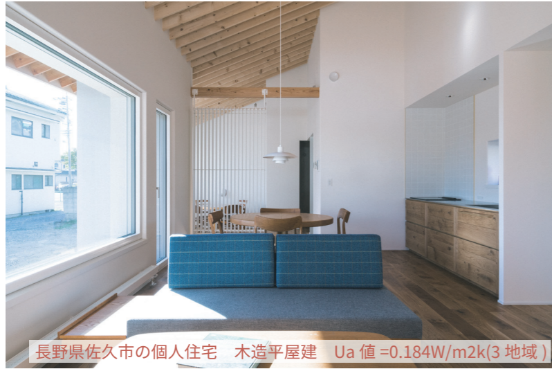
長野県佐久市の個人住宅 木造平屋建 Ua 値 =0.184W/m2k(3 地域)

また、設計事務所としての経験を活かし、そのプロジェクトの設計者に寄り添い、デザイン性の高い納まりや、工法をご提案できるのも特徴です。